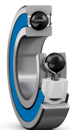
MRC Ultra corrosiebestendig afgedicht groefkogellager

SKF Food Line is een gespecialiseerde serie lagers en lagereenheden die expliciet zijn ontworpen voor de unieke behoeften van de voedingsmiddelen- en drankenindustrie, waarbij de kritische uitdagingen worden aangepakt.