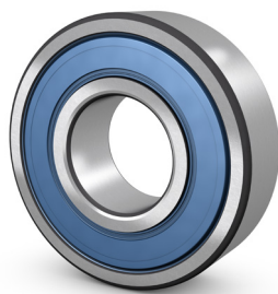
Roestvast stalen groefkogellager