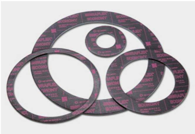
↑ Dichtungen aus SIGRAFLEX ECONOMY