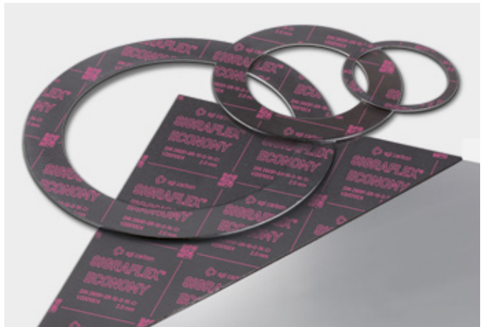
↑ SIGRAFLEX ECONOMY Dichtungsplatten und Dichtungen