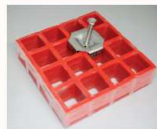
Accessoires de fixation