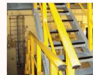
Escaliers, échelles et balustrades