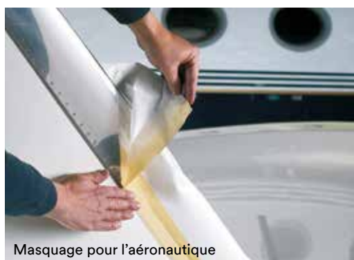
Masquage pour l'aéronautique